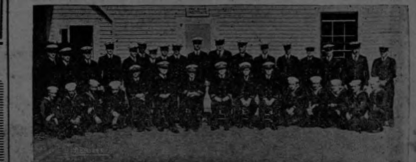
El Instituto de Guarda-Costas es la puerta de la oportunidad para los hombres de este servicio que desean adelantar y que saben medir sus necesidades para mejorar adecuadamente su educación.

Su cooperación es también directa. La Revista "Time" en su edición del 23 de abril pasado, dice: "El Instituto de las Fuerzas Armadas de los Estados Unidos (U. S. Armed Forces Institute) obtiene un gran porcentaje de sus cursos mediante las Escuelas Internacionales".