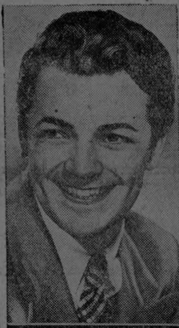
Comel Wilde que interpreta maravillosamente a Chopin en esta película "Canción Inolvidable"

rico siguió con la vista a la extraña mujer como si no pudiera separar sus ojos de ella. Elsner fué quien lo hizo volver a la realidad, preguntándole quien era aquella rara criatura vestida como hombre, con cara y voz de mujer.