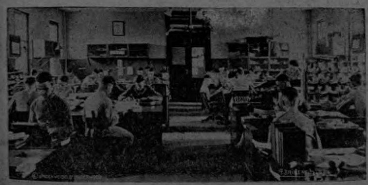
Para impartir instrucción a millares de miembros estudiosos que surcan los mares del globo cumpliendo deberes de su cargo, el Instituto del Cuerpo de Marina de los Estados Unidos tiene que desarrollar una tarea inmensa y de nunca acabar.